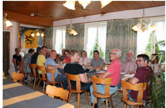
GV im Restaurant Grossmatt

Es ergaben sich viele angenehme Gespräche und natürlich wurde auch ein wenig politisiert. Gemeinsam konnten wir auf ein hoffentlich positives Jahr 2018 anstossen.